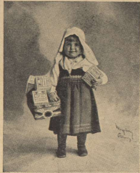
Min mamma använder alltid Mustads margarin.